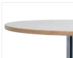
Multiplex Multiplex Multiplis