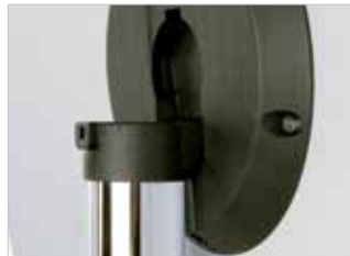
Klappbeschlag Hinge Système de pliage