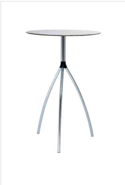
Runder Tisch Round table Table ronde