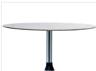
Runder Tisch Round table Table ronde