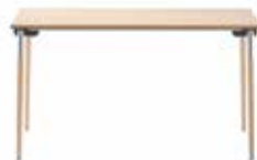
TISCHE, KLAPPTISCHE | TABLES, FOLDING TABLES