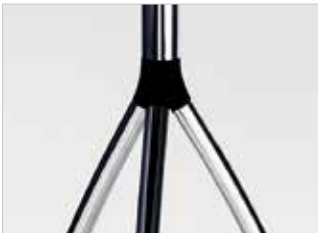
Stahlrohrgestell - Dreibein Steel tube - three-legged Piétement acier - tripode