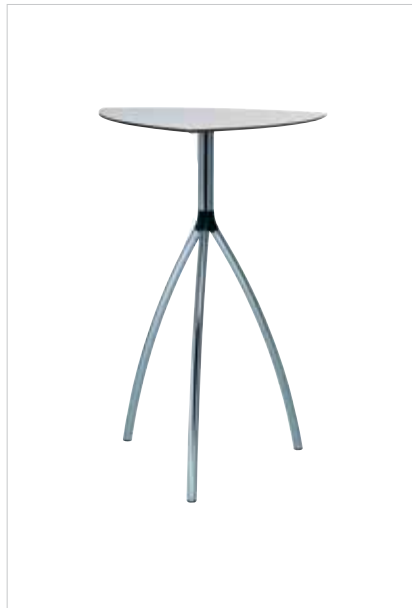
Trigonaler Tisch Trigonal table Table triangonale