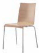
STAHLROHRSTÜHLE | STEEL TUBE CHAIRS