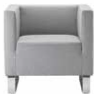
POLSTERMÖBEL | UPHOLSTERED FURNITURE