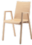
HOLZSTÜHLE | WOODEN CHAIRS