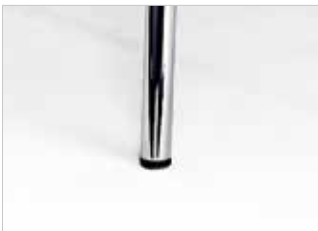
Polyamidgleiter Polyamide glider Patins en polyamide