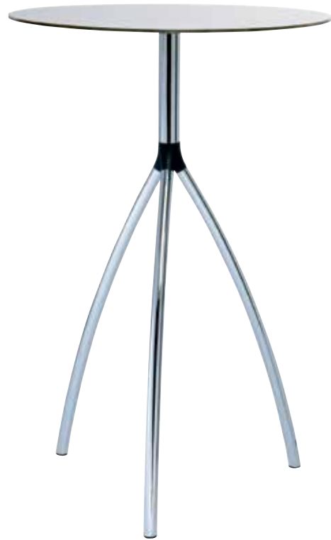
Klapp-Stehtisch | foldable stand up table | table haute pliante