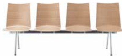
SITZBÄNKE | BENCHES