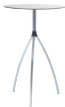
STEHTISCHE | STAND-UP TABLES