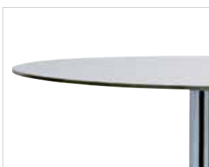
Resopal-Massiv High-pressure laminate Stratifié compact