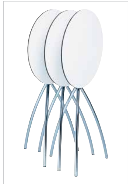
Enge Staffelung Tight staggering Emboîtement avantageux